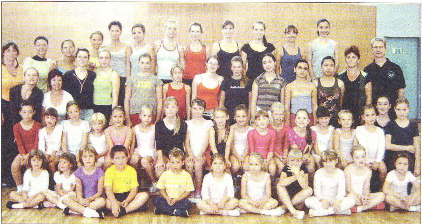
Abschluß des Trainingslagers in Gohrau, welches der Verein im September durchführte. Alle Gruppen waren mit dabei und haben neue Tänze einstudiert oder bereits bekannte weiter verbessert.